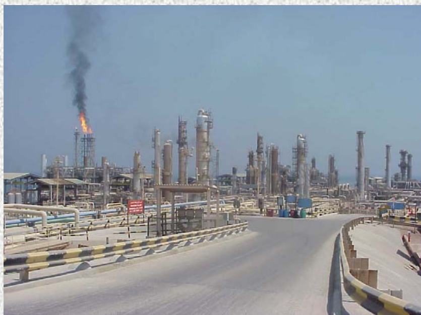
Das Island (United Arab Emirates - Perzische zee)